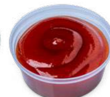
Ketchup 1pz: 1,00