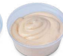
Salsa Rosa 1pz: 1,00

La data applicata nella vaschetta è quella di preparazione e confezionamento. Da quella data, se conservata ad una temperatura di +4°C ha una durata di 7 giorni.