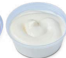
Maionese 1pz: 1,00