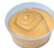
Salsa BonGustaio 1pz: 1,00